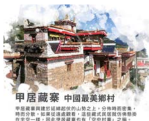
甲居藏寨 中國最美鄉村

甲居藏寨興建於延續起伏的山勢之上，分佈時而密集，時而分散。如果從遠處觀看，這些藏式民居就像彷彿懸掛在空中一樣，因此甲居藏寨也有「空中村寨」之稱。