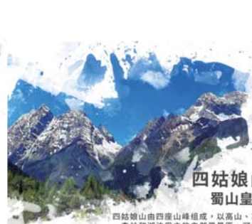
四姑娘山 蜀山皇后

甲居藏寨興建於延續起伏的山勢之上，分佈時而密集，時而分散。如果從遠處觀看，這些藏式民居就像彷彿懸掛在空中一樣，因此甲居藏寨也有「空中村寨」之稱。